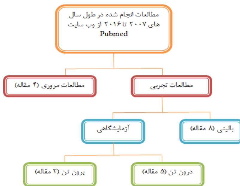
شکل ۲- طبقه‌بندی مطالعات انجام در طول سال‌های ۲۰۰۷ تا ۲۰۱۶ در زمینه بررسی اثرات داروهای NSAIDs در بیماری پارکینسون از پایگاه داده‌های PubMed.

امروزه تحقیقات زیادی به بررسی اثرات NSAIDs و اثر بخشی این ترکیبات دارویی در بیماری پارکینسون پرداخته‌اند که نتایج حاصل در این بررسی‌ها در مواردی متناقض است. در بعضی از این مطالعات اثر بخشی مصرف NSAIDs در کاهش پیشرفت بیماری پارکینسون نشان داده شده و در بعضی دیگر از